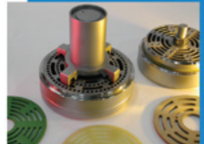
Hoog vermogen kleppen