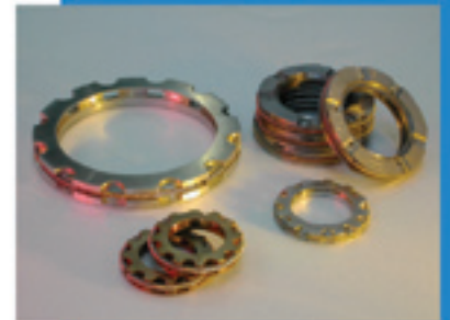
Dichtingsets oliekeringen en schrapers