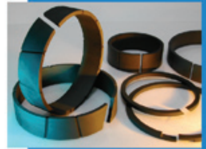
Dichtingsegmenten en steunringen