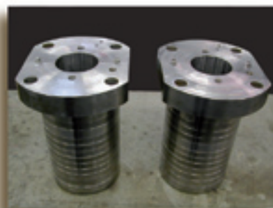
Pakkingsets voor en na revisie